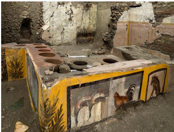
thermopolium (“fast food” shop) from Pompeii