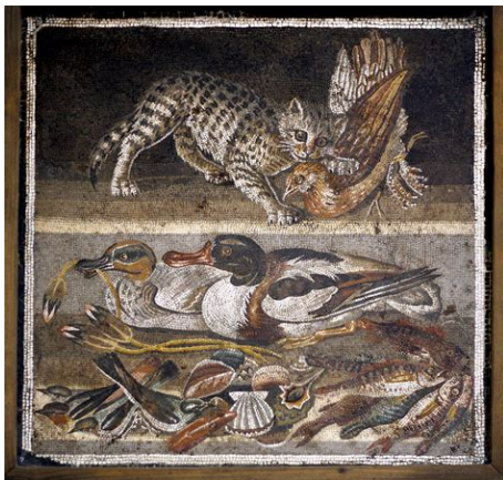
a cat and other animals, House of the Faun, Pompeii