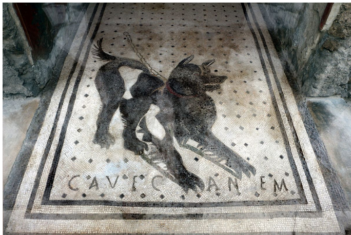
mosaic in the House of the Tragic Poet, Pompeii