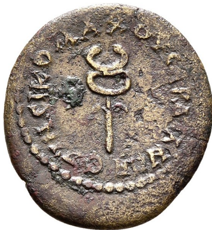
caduceus found on Roman coin in Turkey