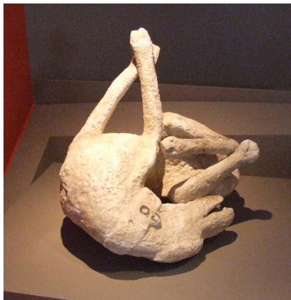
plaster cast a guard dog from Pompeii