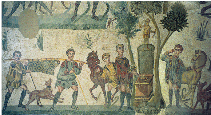
mosaic of a hunting scene in Casale, Italy