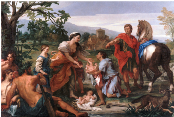
The Finding of Romulus and Remus , Carlo Maratta (between 1680-1692)