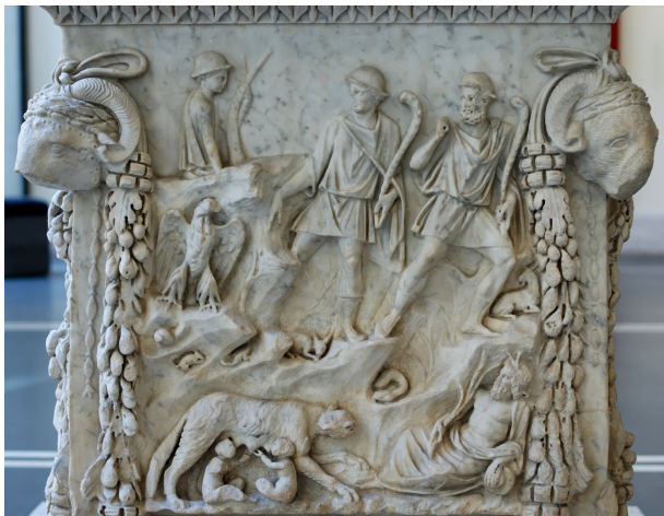
Altar of Venus and Mars