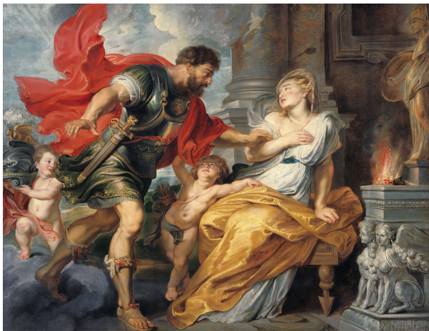
Mars and Rhea Silvia , Peter Paul Rubens (1617)