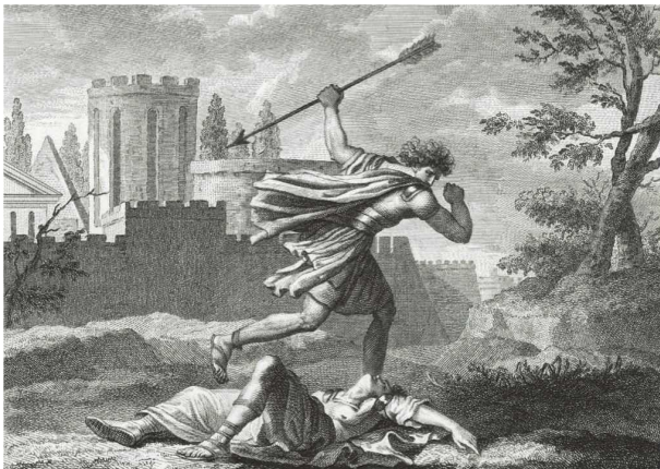
The death of Remus (19th century engraving)