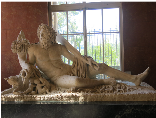
Allegorical Sculpture of the Tiber River (Louvre)