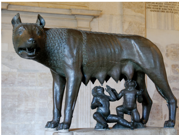
Capitoline Wolf (11th and 16th centuries, Musei Capitolini)