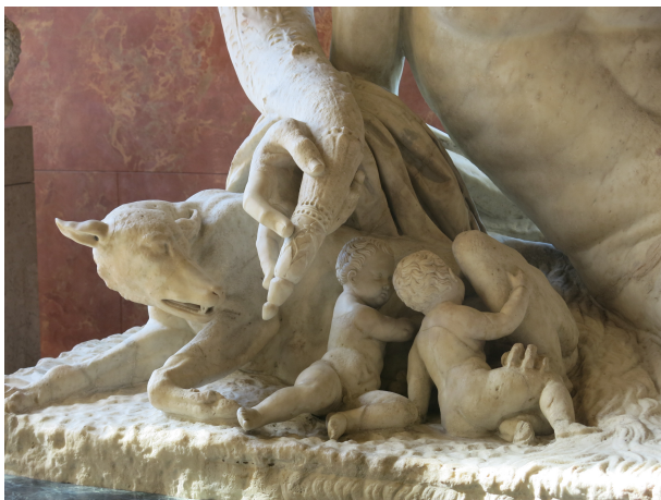
Detail from the River Tiber allegory (Louvre)