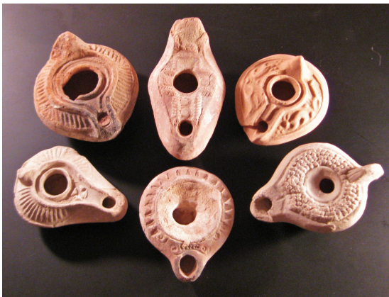
several clay lucernae