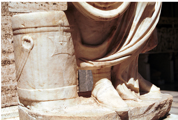
a scrinium at the base of a statue