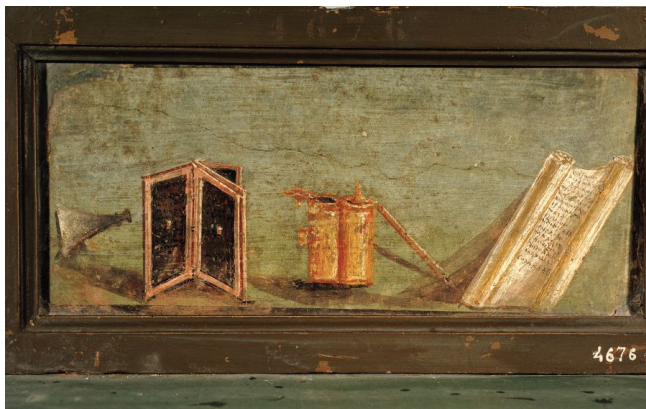
a fresco with a tabella , two capsae , and a volūmen