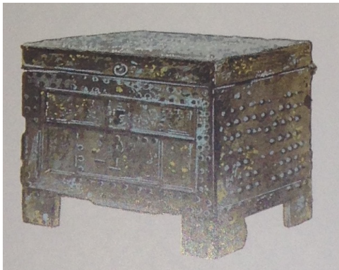
an ancient arca