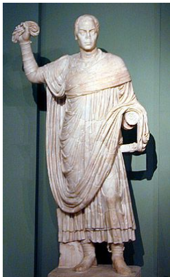
a statue with a mappa