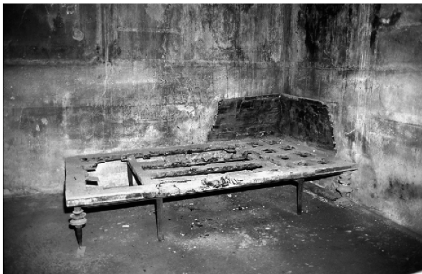
a wooden lectus from Herculaneum