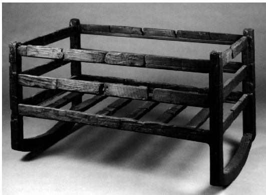
a wooden cunae from Herculaneum