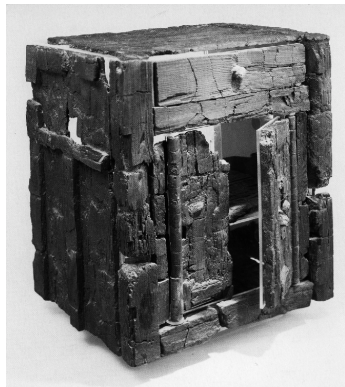
a wooden armarium from Herculaneum