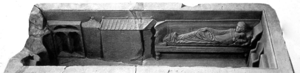
a sarcophagus with furniture details