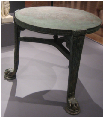
a bronze mēnsa from Pompeii